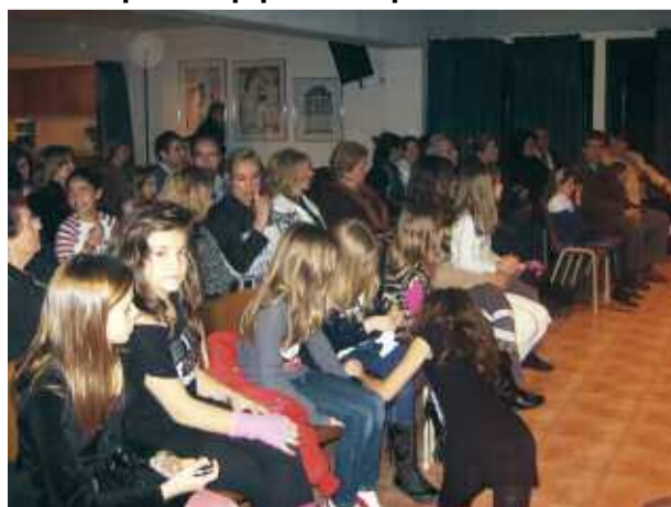
Φίλοι και γονείς παρακολουθούν τις αθλήτριες στο πρόγραμμα τους