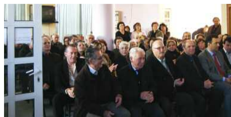
Κόσμος πολύς παραυρέθηκε στη Γενική Συνέλευση