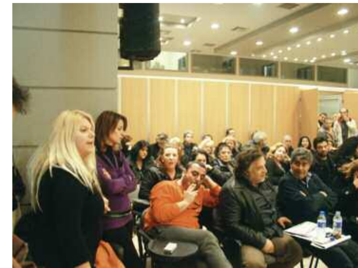
Εργαζόμενοι του ΞΕΝΙΟΥ

υποστήριξε ότι πρόκειται για απλήρωτους εργαζομένους του Δήμου, επέλεξε να ψηφιστεί ομόφωνα το θέμα και πρότεινε – μετά την ψήφιση – να γίνει διαπραγματευτική επιτροπή ελέγχου. Σύσσωμη η αντιπολίτευση αντέδρασε έντονα, ζήτησε τα ονόματα των εργαζομένων και ξεκαθάρισε ότι δεν μπορεί να υπογράψει σε λευκό χαρτί. Εντύπωση προκάλεσε, μάλιστα, το γεγονός πως η διοίκηση δεν δέχθηκε ούτε την αποχώρηση της αντιπολίτευσης στο συγκεκρι-