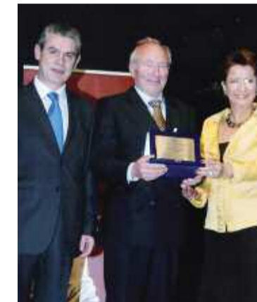
Βράβευση του Καθηγητή κ. Hans Joachim Frischbier

Με μεγάλη επιτυχία και συγκινητική συμμετοχή πραγματοποιήθηκε ο εορτασμός των 30 χρόνων της Ελληνικής Εταιρίας Μαστολογίας (ΕΕΜ) και η παρουσίαση του αναμνηστικού φωτογραφικού λευκώματος στην αίθουσα Φίλων του Μεγάρου Μουσικής, παρουσία εκπροσώπων της Α.Θ. Παναγιώττος, του Αρχιεπισκόπου Αθηνών & Πάσης Ελλάδος, τ. Υπουργών, Βουλευτών, Δημάρχων, Νομαρχιακών και Δημοτικών Συμβούλων, Προέδρων, Φορέων και Οργανισμών, Καθηγητών, Δικαστικών, Ιατρών κ.λ.π.