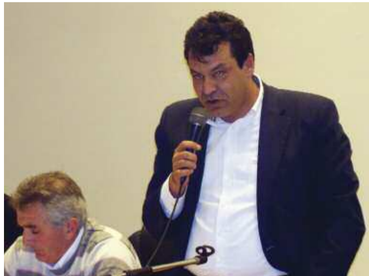
Θα μονιμοποιηθούν στο Δήμο, μόνο όσοι δουλεύουν πραγματικά, είπε ο Δήμαρχος.