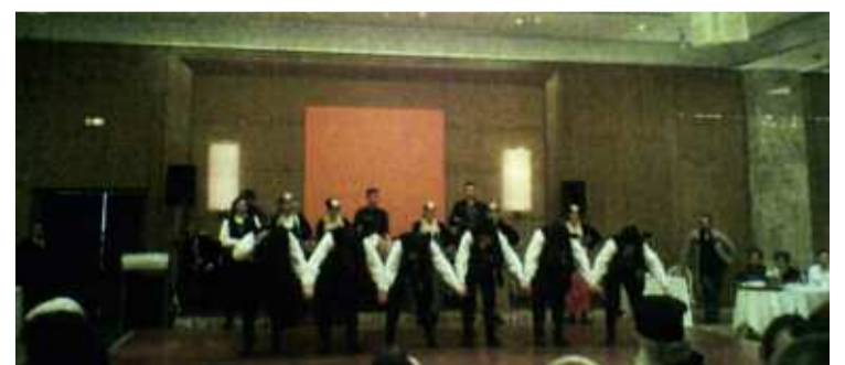
Το χορευτικό του Καπετάν Ευκλείδη

Να σημειωθεί, ότι τον Πατριάρχη Ιεροσολύμων εκπροσώπησε ο Αρχιεπίσκοπος Θαβάρειος, Μεθόδιος