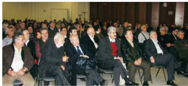
Κατάμεστη η αίθουσα εκδηλώσεων