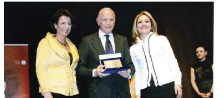
Βράβευση του Καθηγητή κ. Aurelio Picciocchi