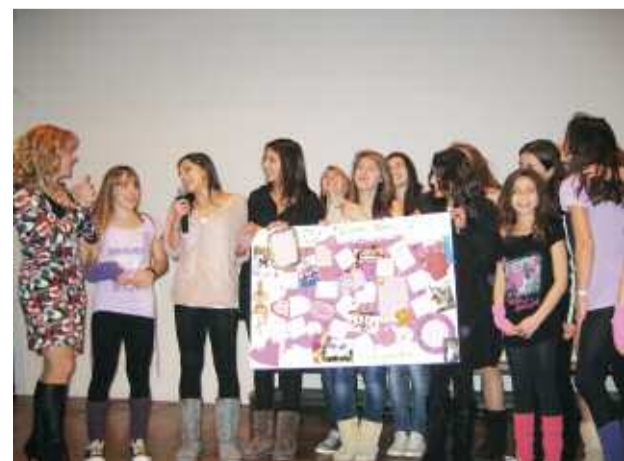
Τα κορίτσια παραδίδουν το δώρο στην προπονήτρια τους