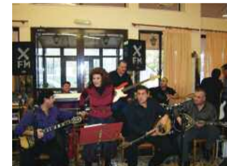
Η λαϊκή ορχήστρα κράτησε αμείωτο το κέφι