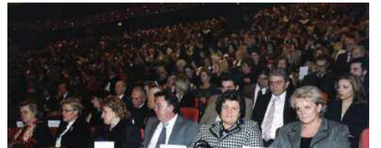
Άποψη από το κοινό

Η βραδιά έκλεισε με την Παράδοσιακή Ορχήστρα «Θρία», ευγενική χορηγία του Δήμου Ασπροπύργου, η οποία παρουσίασε μουσικές από πολλά μέρη του ελληνισμού σε μια σύνθεση από δεξιοτέχνες μουσικούς παραδοσιακών εγχόρδων οργάνων, τη χορωδία και τη χορευτική ομάδα του Πνευματικού Κέντρου Ασπροπύργου που εμφανίστηκε με τις παραδοσιακές χρυσοκέντητες φορεσιές.