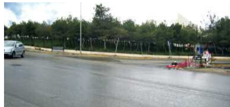
Λιοσίων και Ελευθερίου Φυτά