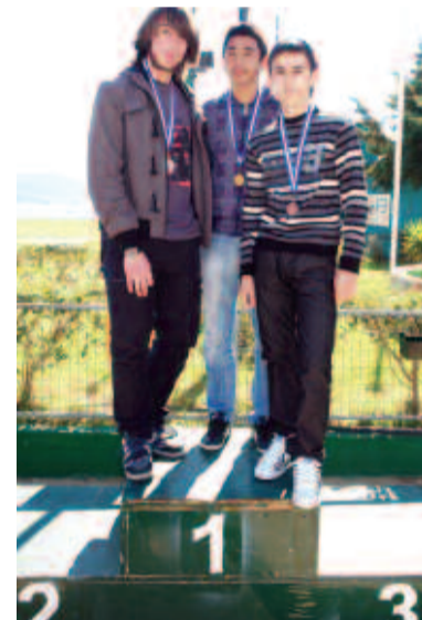
... και μετάλλια στους μαθητές