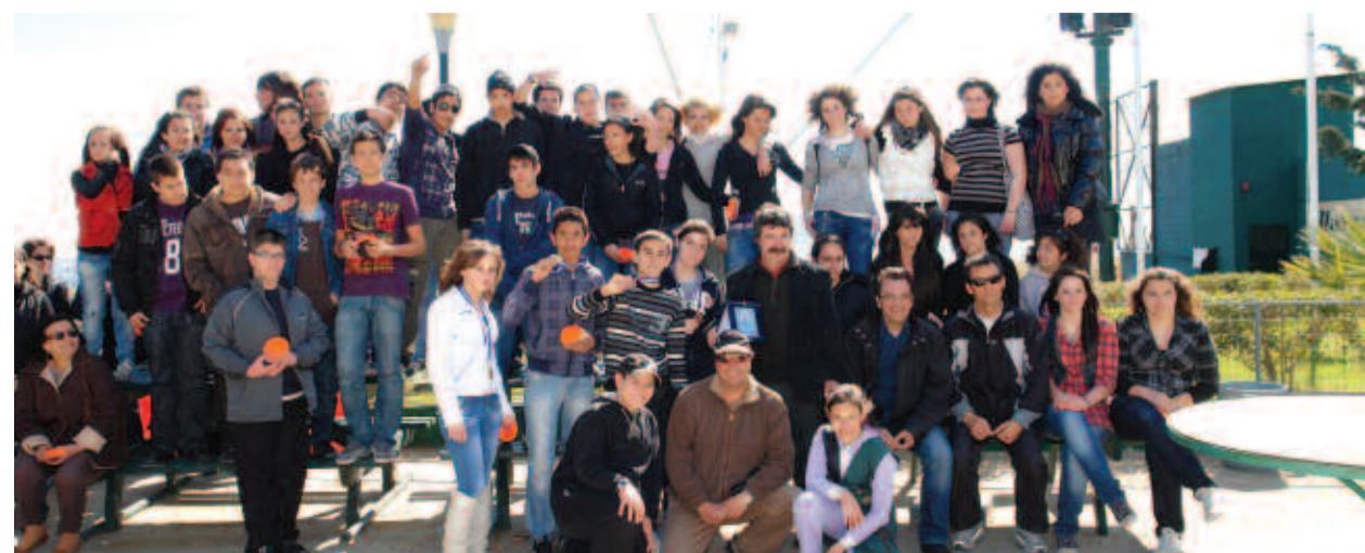
... και στην αναμνηστική φωτογραφία με μέλη του Ομίλου