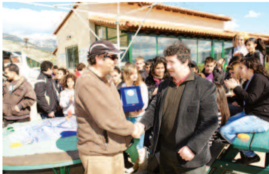
Τιμητική πλακέτα στον Διευθυντή του σχολείου...

Η φιλοξενία από τα μέλη του Σκοπευτικού Ομίλου Αχαρνών ήταν υποδειγματική (σάντουιτς, αναψυκτικά, σοκολάτα ρόφημα για τα παιδιά, καφέδες για τους καθηγητές, κλπ) ενώ στο βιβλίο εντυπώσεων του Ομίλου, καθηγητές και μαθητές έγραψαν για την εμπειρία που έζησαν στον συγκεκριμένο χώρο.