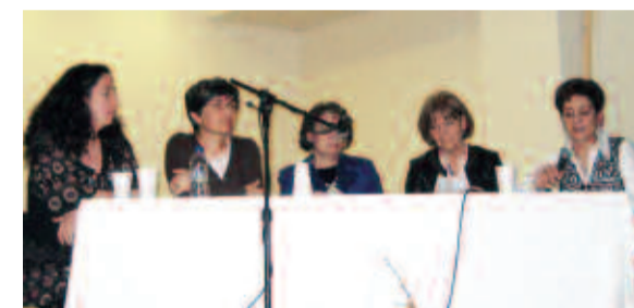
Εκπρόσωποι του Κέντρου Βρεφών η Μητέρα ενημερώνουν τον κόσμο