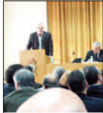
Σύσκεψη για την πυροπροστασία με αιχμές των Δημάρχων...