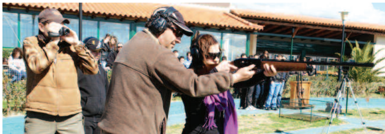
Μαθητές και μαθήτριες στην πρώτη τους βολή...