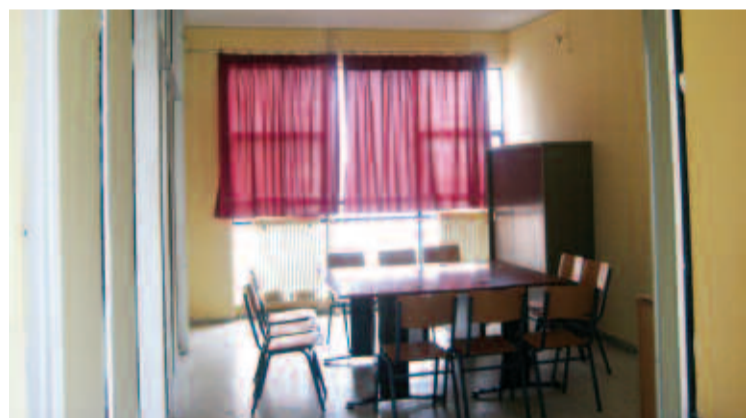
Η αίθουσα που διαμόρφωσαν οι μαθητές για να συγκεντρώνονται και να λαμβάνουν αποφάσεις