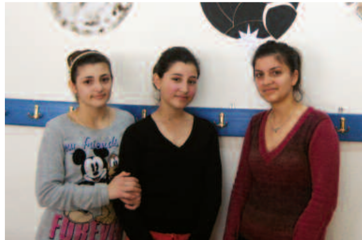
Εν αναμονή του βραβείου Γαλλοφωνίας!