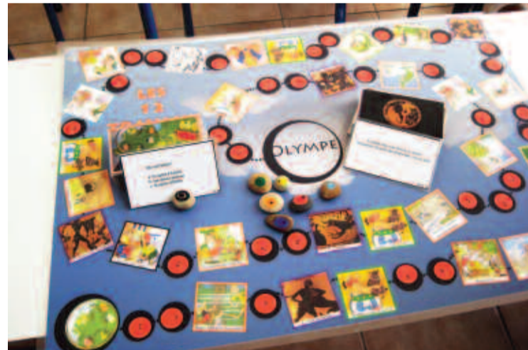
Οι 12 άθλοι του Αστεριζ...

“Οι 12 άθλοι του Αστεριζ”, το οποίο αποτελείται από ερωτήσεις στα γαλλικά. Αξίζει να σημειωθεί, πως οι μαθητές κλήθηκαν να παρουσιάσουν το δημιουργήμα τους στη 3η έκθεση παιδικού και εφηβικού βιβλίου του Εθνικού Κέντρου Βιβλίου (ΕΚΕΒΙ), όπου τιμώμενη χώρα ήταν η Γαλλία, καθώς και σε εκπομπές της τηλεόρασης.