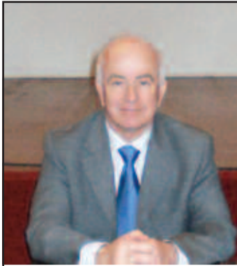
Δριμύ κατηγορώ κατά του Δημάρχου Θρακομακεδόνων από τον Συνεταιρισμό...