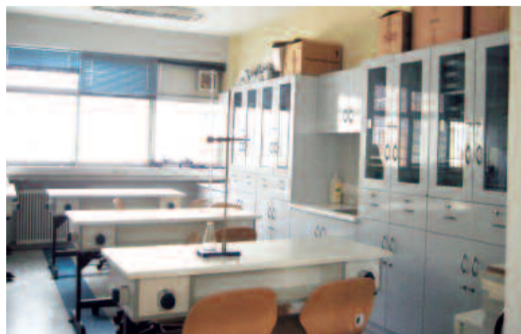
Η αίθουσα Χημείας

της εκλογικής διαδικασίας στη διατήρηση του Δημοκρατικού θεσμού.