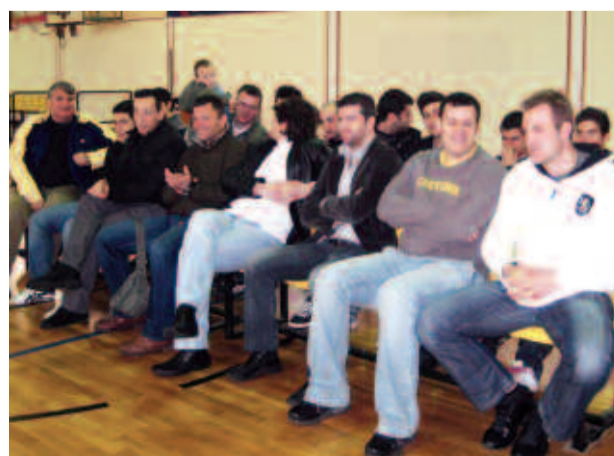
Η ομάδα μπάσκετ του Σωματείου «Αχαρνής»

Από την πλευρά του, ο αντιδήμαρχος Οικονομικών, η διοίκηση του Δήμου Αχαρνών λειτουργεί συλλογικά και προσπαθεί να αξιοποιήσει τα χρήματα των Δημοτών με τον καλύτερο δυνατό και, κυρίως, νόμιμο τρόπο.