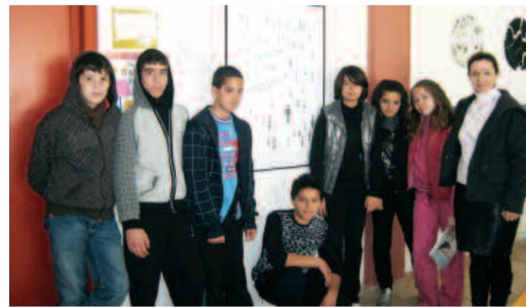
Μαθητές της Α' Γυμνασίου μπροστά από το κολλάζ με τα κυκλαδικά εδώλια

Ευελπιστώντας να κατακτήσουν τη πρώτη θέση στο διαγωνισμό γαλλοφωνίας του Γαλλικού Ινστιτούτου Αθηνών, οι μαθη-