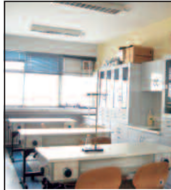
11ο Γυμνάσιο και 3ο Λύκειο Αχαρνών κερδίζουν το στοίχημα ενός σύγχρονου σχολείου...