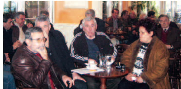
Λιγότεροι οι κάτοικοι που προσήλθαν στη συνέλευση