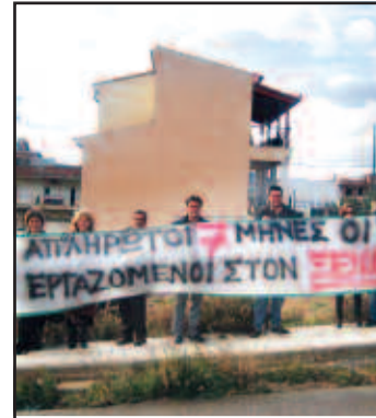
Νέα συνάντηση στο Υπουργείο Εργασίας για τον ΞΕΝΙΟ...