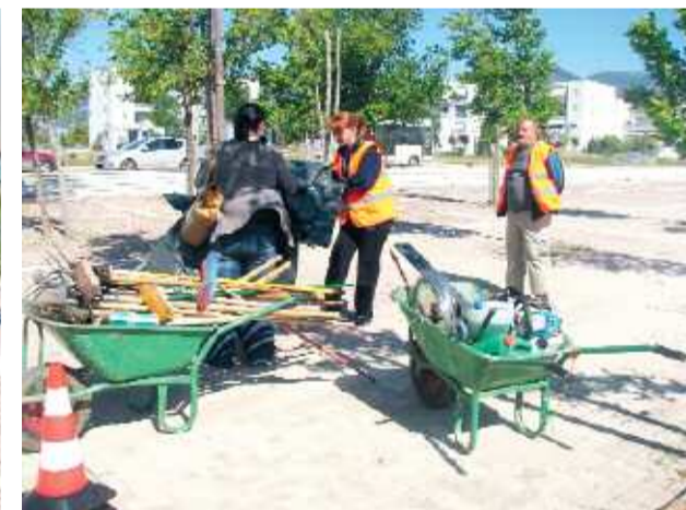
Και τα συνεργεία ξεκινούν τον καθαρισμό