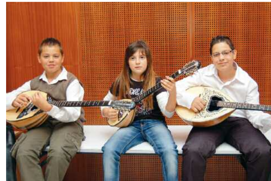
Μικρά παιδιά, μεγάλα ταλέντα...