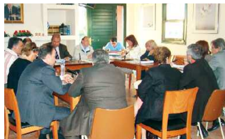
Το Δ.Σ. Θρακομακεδόνων σε απαρτία