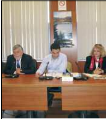
Πανελλαδική πρωτοβουλία ΚΕΠΕΔΑ για τις Κοινωφελείς Επιχειρήσεις... σελ.9