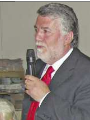
Δεσμεύσεις για Ολυμπιακό Χωριό σε Φωτιάδη... σελ.10