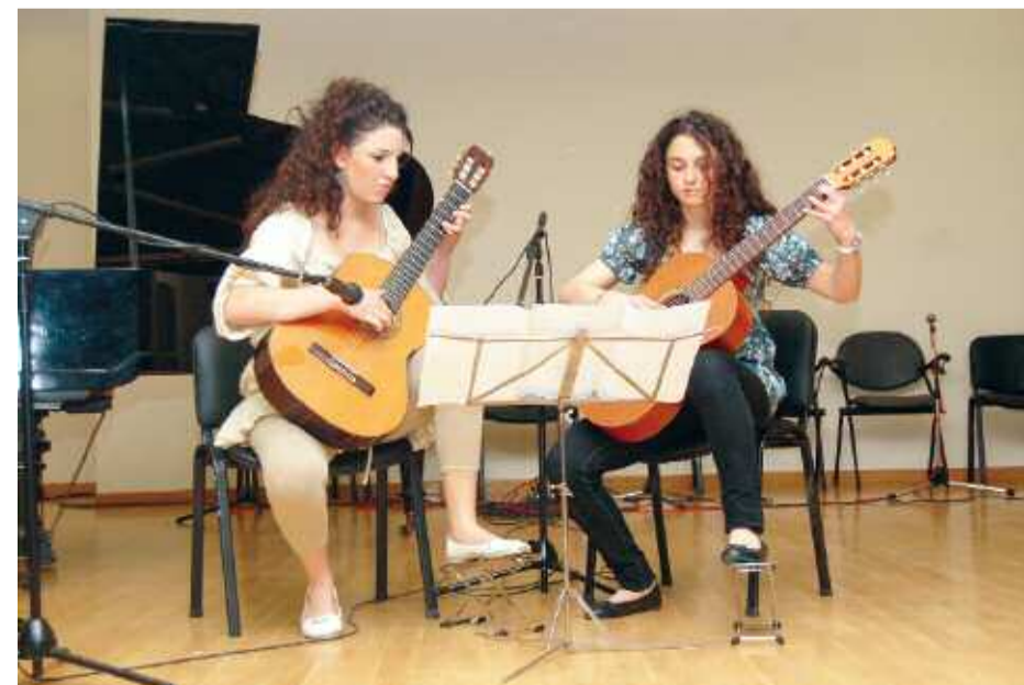
Μαθήτριες του Ωδείου