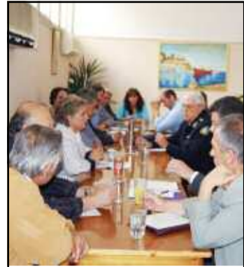
Έξαρση παραβατικότητας στο Ζεφύρι... σελ.17