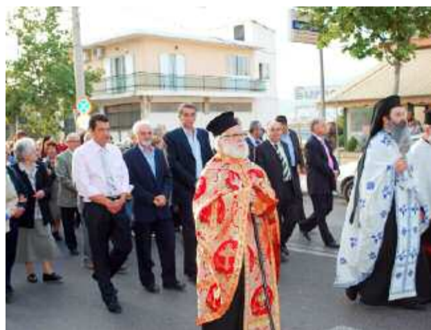
Ιερείς, επίσημοι και πλήθος κόσμου...