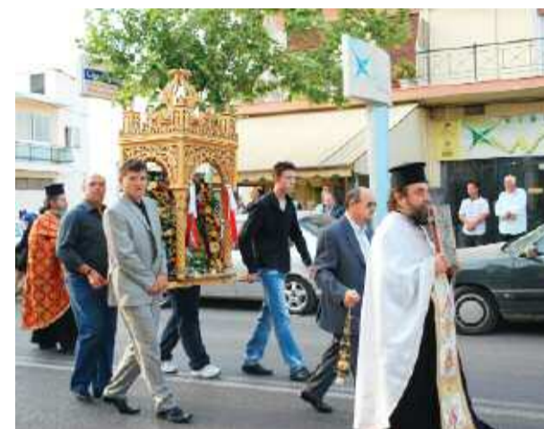
Κάτοικοι της Ζωφριάς σηκώνουν την εικόνα

ανήμερα της γιορτής τελέστηκε η Θεία Λειτουργία και το απόγευμα πραγματοποιήθηκε η Περιφορά της εικόνας, συνοδεία πλήθους πιστών και επισήμων. Το παρών έδωσαν ο Δήμαρχος, εκπρόσωποι του Κοινοβουλίου και της Νομαρχιακής Αυτοδιοίκησης, Αντιδήμαρχοι, Πρόεδροι των Νομικών Προσώπων του Δήμου, εκπρόσωποι των Δημοτικών Παρατάξεων, πολλά μέλη του Δημοτικού Συμβουλίου, εκπρόσωποι Μαζικών Φορέων και πολύς κόσμος.