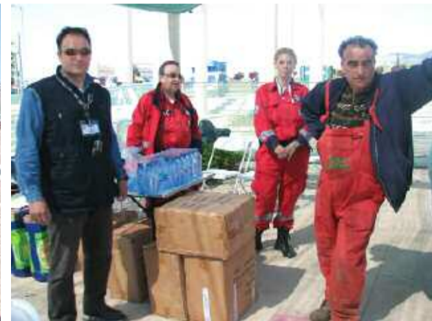
Η απαραίτητη στάση για λίγο νερό