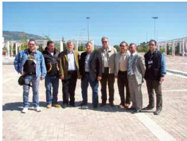
Ο Δήμαρχος και πολλοί δημοτικοί σύμβουλοι ήταν εκεί