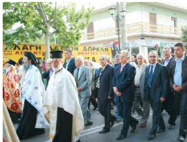
... στην περιφορά της εικόνας

Τον Άγιο Γεώργιο και την εκκλησία που καθημερινά επισκέπτονται για να ανάψουν ένα κερί τίμησαν και φέτος οι κάτοικοι της Ζωφριάς. Την παραμονή τελέστηκε ο Μέγας Πανηγυρικός Εσπερινός, μετ' Αρτοκλασίας ενώ