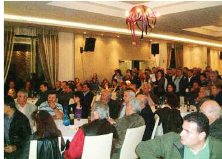
Πολύς ο κόσμος που παρακολούθησε την παρουσίαση