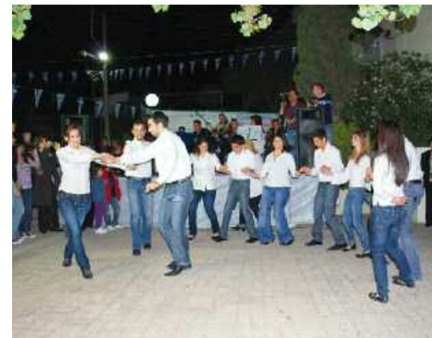
Στιγμιότυπο από το γλέντι του Συλλόγου