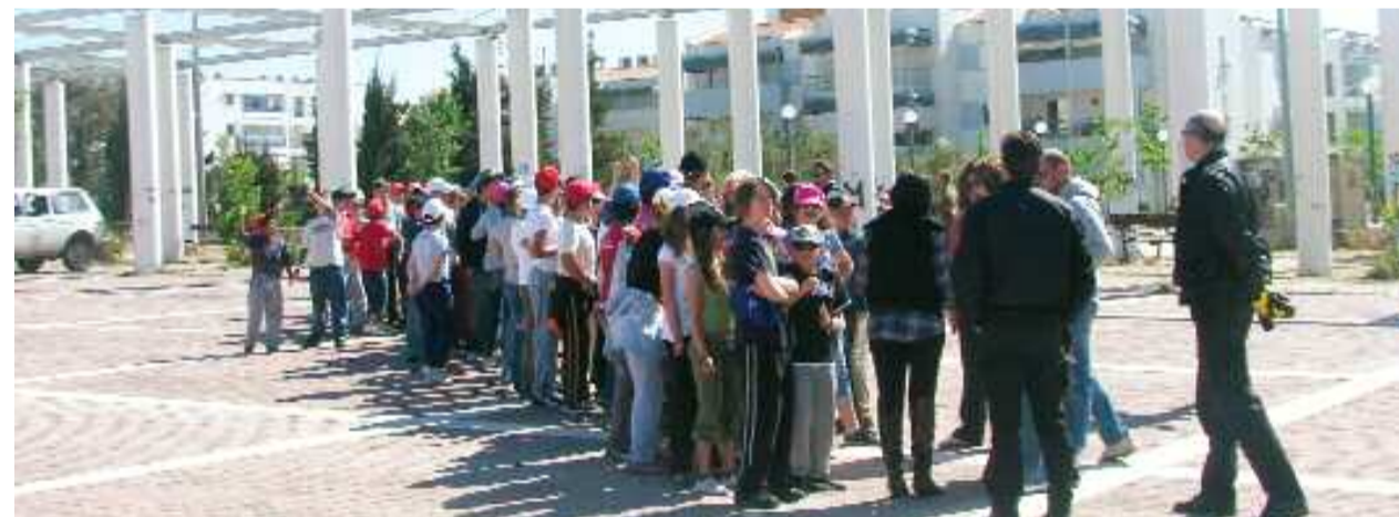
Τα παιδιά ακούν τις οδηγίες