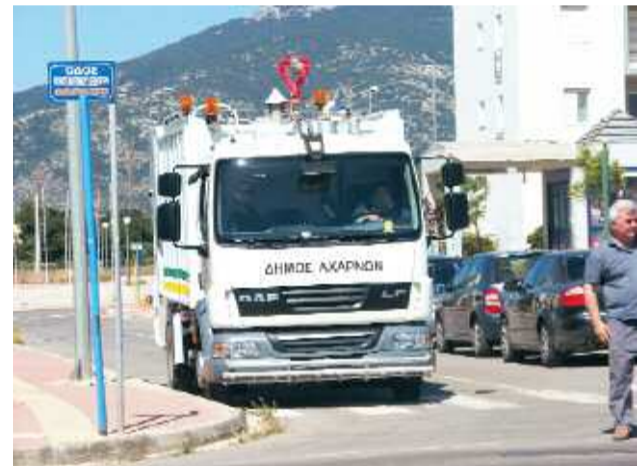
Όχημα του Δήμου Αχαρνών συμμετείχε στον καθαρισμό