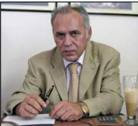
Παρέμβαση του Νίκου Παπαδήμα για το νέο Δήμο Φυλής... σελ.8