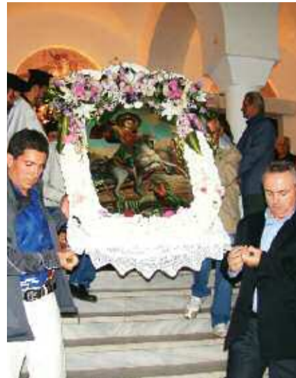
Η εικόνα του Αγίου Γεωργίου