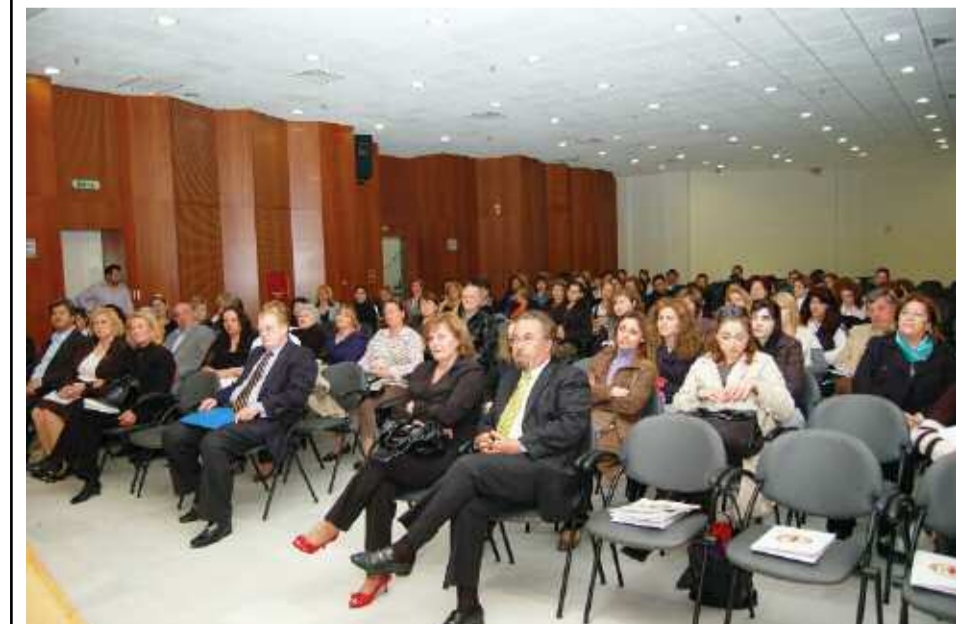
Αρκετός ο κόσμος που παρακολούθησε την εκδήλωση