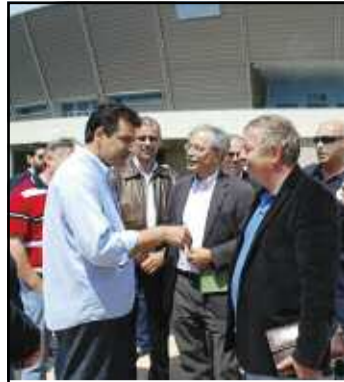
Προς αξιοποίηση του Κέντρου Πάλης στα Άνω Λιόσια... σελ.30