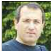
Αθανασιάδης Γεώργιος Παγκόσμιος Πρωταθλητής Πάλης, Δημ. Σύμβουλος, Πρόεδρος ΑΟΔΑ