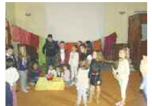
Όταν τα παιδιά κάνουν θέατρο...