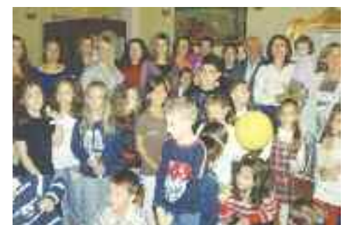
Αναμνηστική φωτογραφία με παιδιά και γονείς