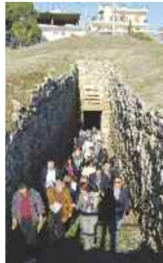
Επίσκεψη στο θολωτό Τάφο

Οι χώροι που επισκέφτηκαν ήταν ο Θολωτός Τάφος, η Αρχαιολογική Συλλογή, η Πινακοθήκη, το Λαογραφικό Μουσείο, ο Τύμβος του Σοφοκλή αλλά και το Αδριάνειο υδραγωγείο στο Ολυμπιακό χωριό. Όλοι απόλαυσαν την βόλτα και ενημερώθηκαν για την μεγάλη ιστορική σημασία του δήμου Αχαρνών. Ο επικεφαλής της παράταξης Σωτήρης Ντούρος δεσμεύτηκε πως όποιο και αν είναι το εκλογικό αποτέλεσμα θα σταθεί δίπλα στις ανάγκες των χώρων για διάρκεια μέσα στον χρόνο και ανάπτυξη των παροχών τους.