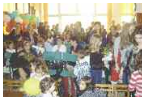
... οι γονείς καμαρώνουν