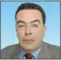
Μπουζιάνης Σωτήριος Ιατροδικαστής