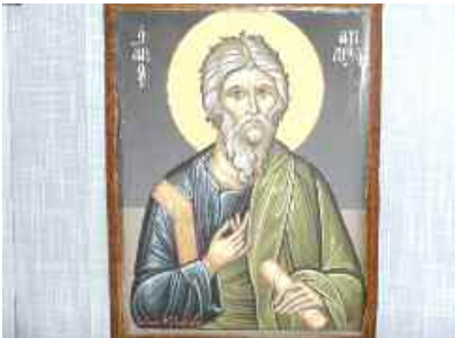
Δημιουργίες από τα τμήματα καλλιτεχνικών Πνευματικού κέντρου Ζεφυρίου