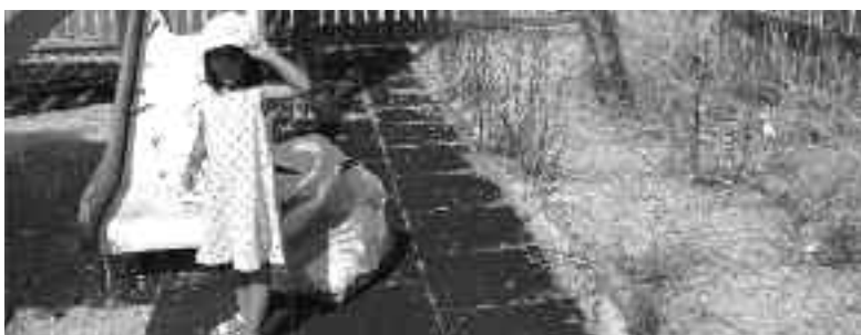
Και τα μικρά... επί το έργον