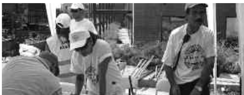
Στην Πύλη Α' δόθηκε το ραντεβού των εθελοντών

Επιπλέον, εντύπωση προκάλεσε το γεγονός ότι παρόλο που η δράση αφορούσε στον καθαρισμό τμήματος του Ο.Χ, οι κάτοικοι του- κατά τα λοιπά- πρότυπου αυτού οικισμού δεν έδωσαν το δυναμικό «παρών», όπως αναμενόταν.