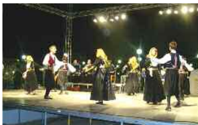
Αθλητικός Οργανισμός δημοτικής κοινότητας Φυλής