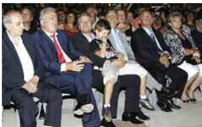
Βλέμματα στραμμένα στα βεγγαλικά που σκίζουν τον ουρανό