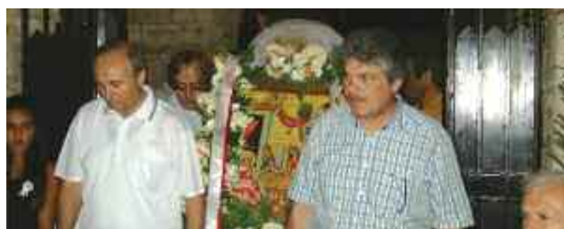
Η περιφορά της Ιερής Εικόνας