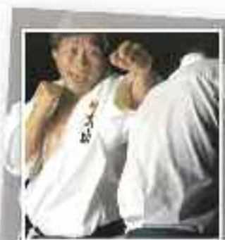
Επίσημο World Wide International Oyama Karate 8TH DAN SHIWA DAN JAPAN