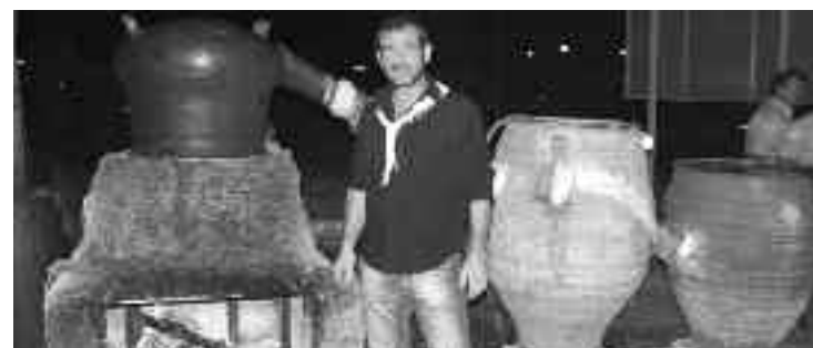
Μέλος του Συλλόγου βοηθά στην Παρασκευή της τσικουδιάς