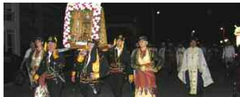
Πλήθος πιστών ακολούθησαν την εικόνα