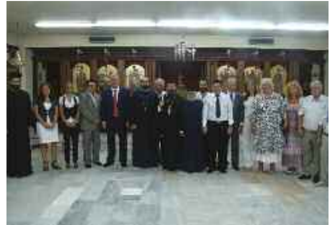
Αναμνηστική φωτογραφία με επισήμους και ιερείς