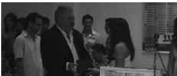
Ο Δήμαρχος Φυλής παραδίδει το βραβείο σε μαθήτριά