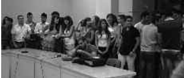
Μερικοί από τους επιτυχόντες