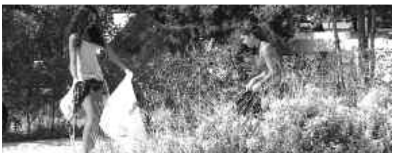
Περιβαλλοντικά ευαίσθητοι από μικροί...