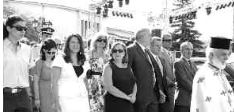
Επίσημοι και πλήθος κόσμου στην περιφορά της Εικόνας