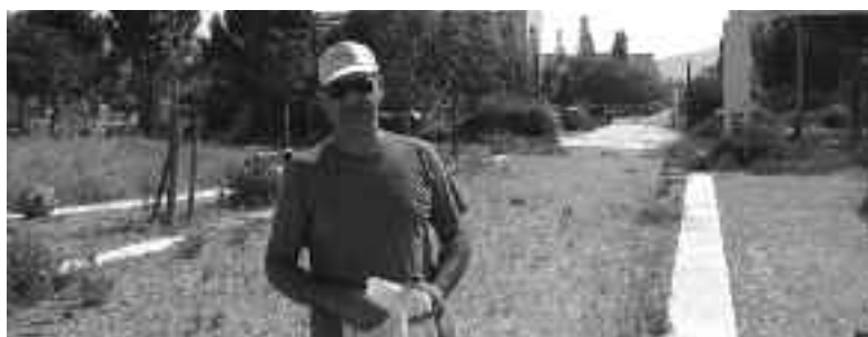
Ενεργοί πολίτες εκ πεποιθήσεως