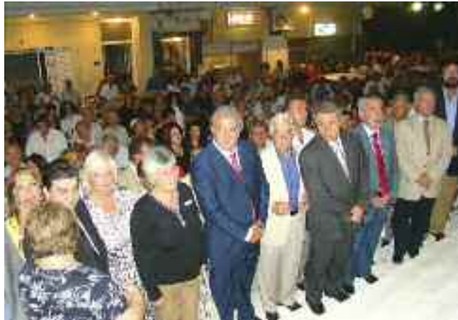
Πλήθος κόσμου και επισήμων στη λιτανεία