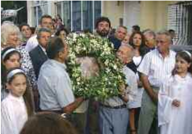
Περιφορά της ιερής εικόνας