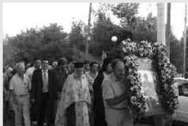
Η λιτανεία της Ιερής Εικόνας