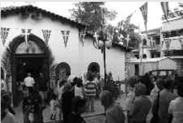
Η εκκλησία του Αγίου Φανουρίου

το προαύλιο χώρο της εκκλησίας. Ανήμερα το απόγευμα τελέσθηκε η λειτουργία και η περιφορά της εικόνας με την συνοδεία της Φιλαρμονικής ορχήστρας δήμου Φυλής.