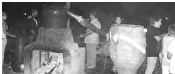
Το ρακοκάζανο βράζει

Αξίζει, τέλος, να επισημάνουμε την ενότητα των μελών του Συλλόγου, την αλληλεγγύη και την ανιδιοτελή προσφορά τους προς τον σύλλογο.