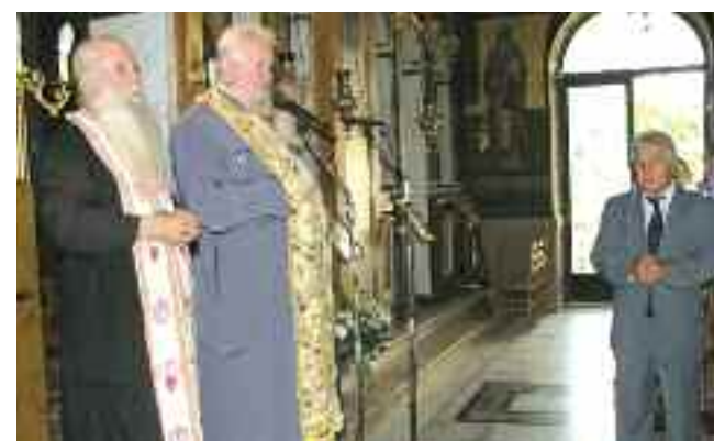
Επιμνημόσυνη δέηση για τις ψυχές που χάθηκαν