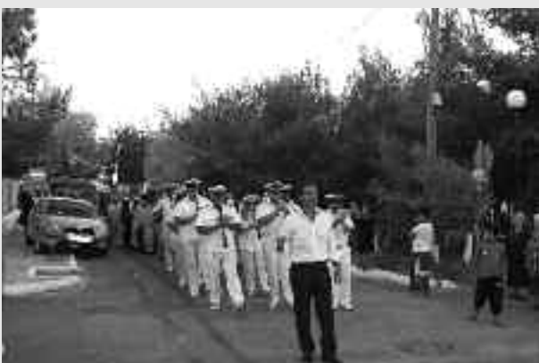
Η Φιλαρμονική δήμου Φυλής