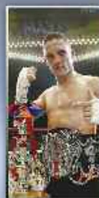
KNOCK DOWN KUMITE