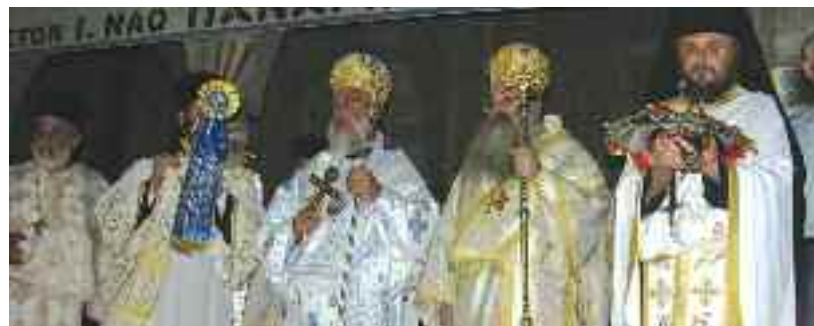
Ο Μητροπολίτης Αθηνάγορας χοροστάτησε στον πανηγυρικό εσπερινό