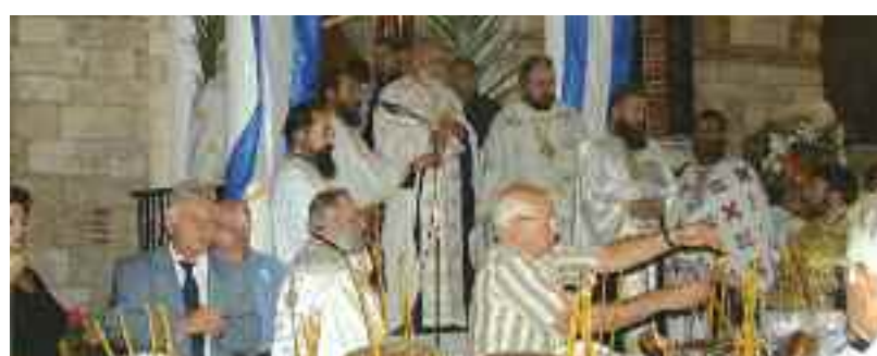
Σύσσωμος ο ιερατικός κόσμος