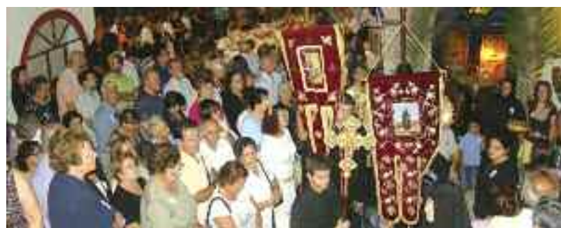
Πλήθος πιστών παραβρέθηκε στον εορτασμό