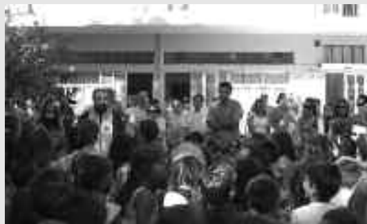
Από τον αγιασμό στα εκπαιδευτήρια «Γιαννημάρα»

Γέμισαν από χαρούμενες παιδικές και νεανικές φωνές τα σχολεία των Αχαρνών, την πρώτη ημέρα της νέας σχολικής χρονιάς, οπότε και πραγματοποιήθηκε ο καθιερωμένος αγιασμός. Με τα λόγια μιας βραβευμένης με Νόμπελ ποιήτριας ο Μητροπολίτης Ιλίου, Αχαρνών και Πετρούπολης Ιλίου, Αχαρνών και Πετρούπολης Αθηνάγορας ευχήθηκε καλή σχολική χρονιά στη μαθητική κοινότητα. «Δεν είναι πολύ εύκολο να μιλάμε για την μάθηση, τη γνώση, την παιδεία και γι' αυτό εκτιμώ τόσο πολύ δύο μικρές λέξεις: «δεν ξέρω». Είναι δείγμα σοφίας το δεν ξέρω διότι με αυτόν τον τρόπο θα μπορούσαμε να ανοίξουμε το ερμητικά κλειστό κελί στο οποίο έχουμε έγκλειστο τον εαυτό μας. Θα δίναμε μια ευκαιρία να ανοίξουμε μια ρωγμή προς το άπειρο. Μη φοβηθείτε αυτές τις δύο λέξεις: «δεν ξέρω». Δεν βρίσκονται εκεί τα εμπόδια που συναντάμε, αλλά στην αυτάρκεια που σαν στάχτη σκεπάζει τον παράδεισο που υπάρχει μέσα μας, αλλά και γύρω μας. Διψάστε για το άγνωστο που ξετυλίγεται μπροστά σας και φωτίστε το με την προσπάθεια σας». Ο καθιερωμένος αγιασμός παρουσία πλήθους γονέων, εκπαιδευτικών και με πρωταγωνιστές τους ίδιους τους μαθητές, πραγματοποιήθηκε τη Δευτέρα και στο εκπαιδευτήριο «Γιαννημάρας», στις Αχαρνές. Ο διευθυντής του σχολείου Βαγγέλης Νεοχωρίτης ευχήθηκε καλή σχολική χρονιά στους παλιούς μαθητές και καλό ξεκίνημα στα πρωτάκια.