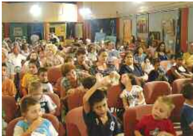
Γονείς και παιδιά παρακολουθούν θέατρο Σκιών