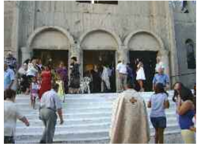
Ιερός Ναός Παναγίας Γρηγορούσας