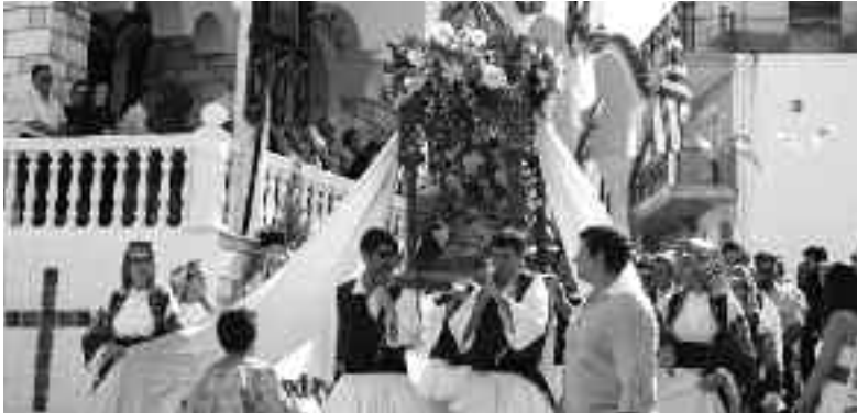
Η Εικόνα της Παναγίας στα χέρια πιστών

Ιδιαίτερα λαμπρές ήταν και οι πολιτιστικές εκδηλώσεις, οι οποίες περιελάμβαναν Πίτσα Παπαδοπούλου, Θάνο Πετρέλη, Έλλη Κοκκίνου, Λάκη Παπαδόπουλο αλλά και τον εκρηκτικό ράπερ ΜΗΔΕΝΙΣΤΗ που ξεσήκωσε τη νεολαία.