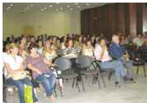
Διευθυντές της πρωτοβάθμιας παρακολουθούν τον πρόεδρο της Επιτροπής