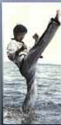
TAE KWON DO