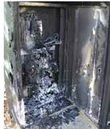
Επισκευή χρειάζονται τα δύο πύλερ φωτισμού προβολών του κολυμβητηρίου