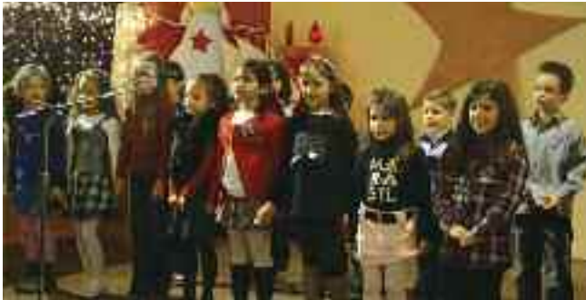
Κάλαντα από μαθητές του 4ου δημοτικού σχολείου Ζεφυρίου