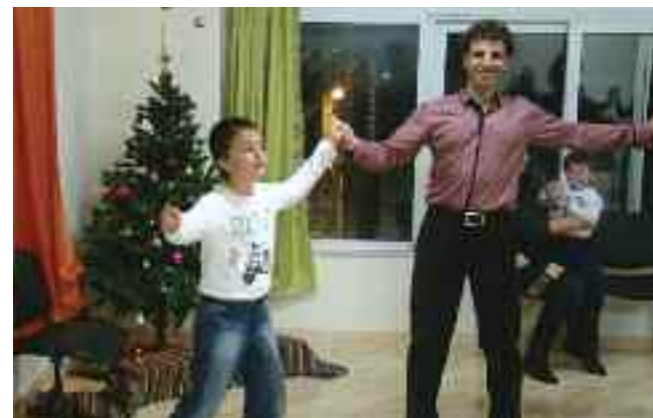
Μικροί και μεγάλοι... στο χορό