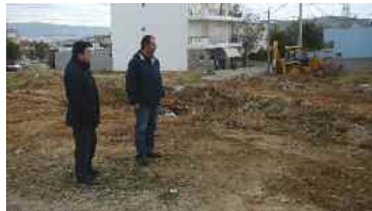
... και επιβλέπουν τα συνεργεία καθαρισμού

μια σχάρα» συμπλήρωσε και εξέφρασε την αισιοδοξία του ότι παρά τις αντίξοες συνθήκες, θα λειτουργήσουν όλα όπως πρέπει.