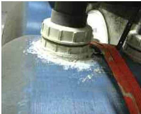
Φωτογραφία από το αντλιοστάσιο

Αξιζει, επίσης, να αναφερθεί ότι στο κολυμβητήριο των Άνω Λιοσίων προπονούνται επίλεκτοι αθλητές της εθνικής ομάδας κολύμβησης, καθώς και παραολυμπιονίκες.