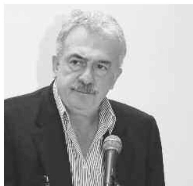
ριση των απορριμμάτων στην Περιφέρεια Αττικής.

B. Ερωτήματα που γεννούνται σε σχέση με τον διεθνή διαγωνισμό, για τη Διαχεί-