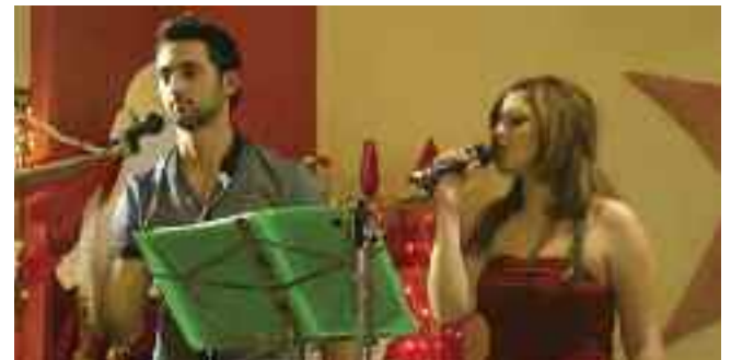
Εξαιρετικές οι φωνές του συγκροτήματος IRIFEZ