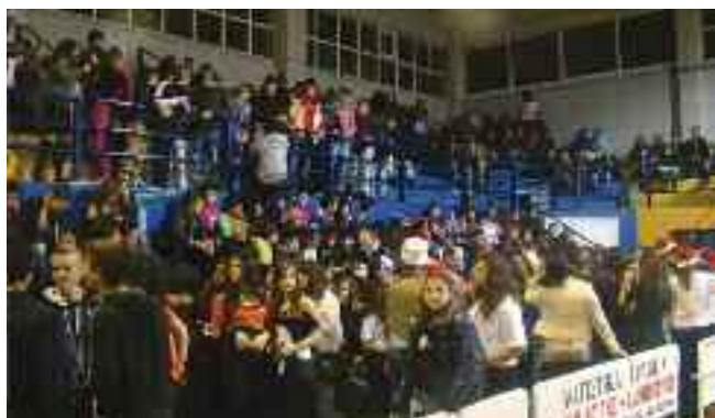
Κατάμεστο το κλειστό Δροσούπολης

Η βραδιά έκλεισε με ένα ξέφρενο πάρτι και την υπόσχεση ότι οι κοινές εκδηλώσεις θα είναι περισσότερες την επόμενη χρονιά.