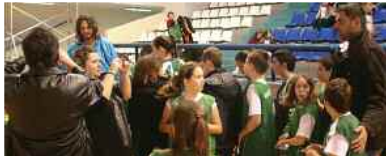
Οι δυο κορυφαίοι αθλητές μαζί με παιδιά