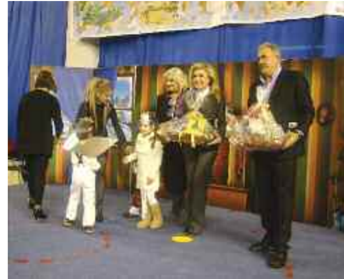
Δώρα από τα παιδιά για τους επισήμους