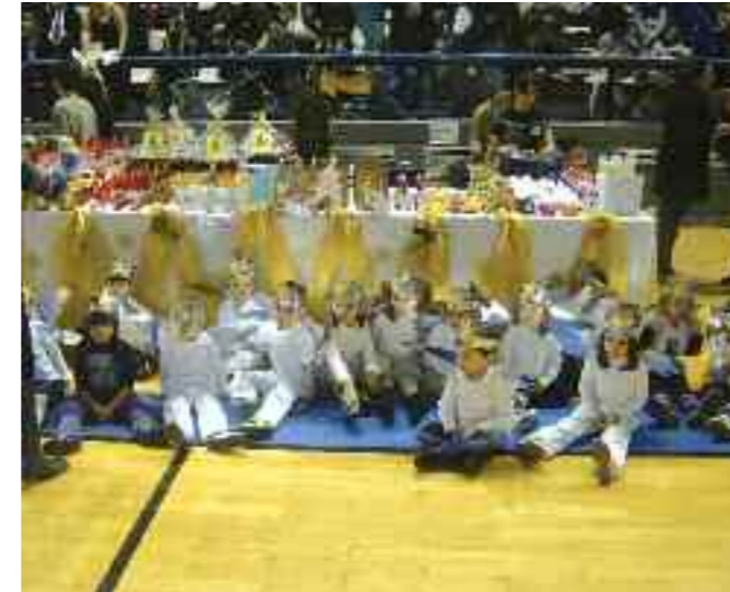
Χριστουγεννιάτικα στολίδια και χειροτεχνίες εκτέθηκαν στο bazaar