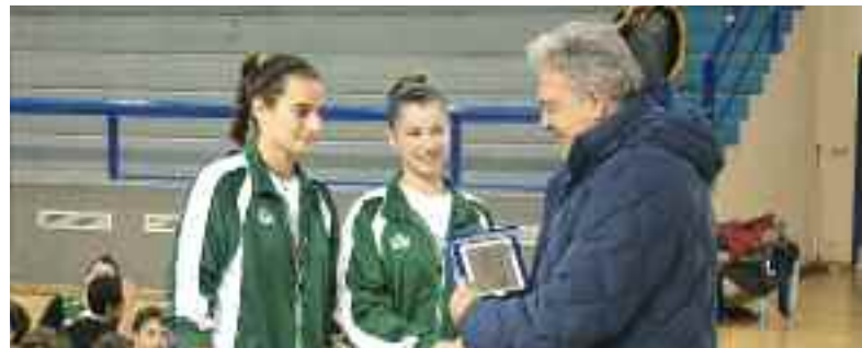
Το δικό του βραβείο παραλαμβάνει από τις αθλήτριες ο δήμαρχος Φυλής