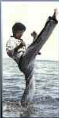
TAE KWON DO