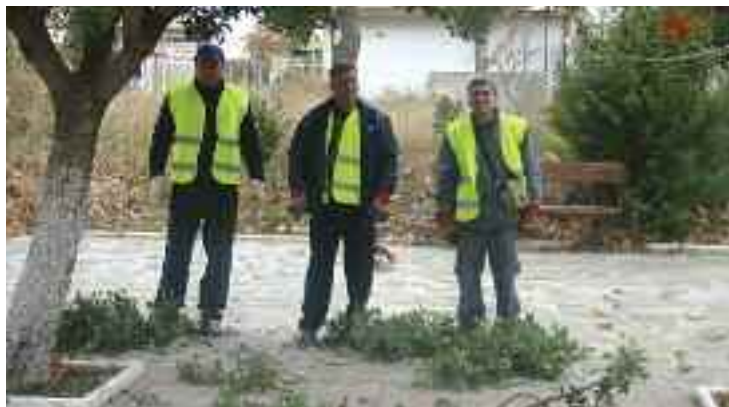
Καθαρίζοντας την πλατεία του Αγ. Ιωάννη Θεολόγου