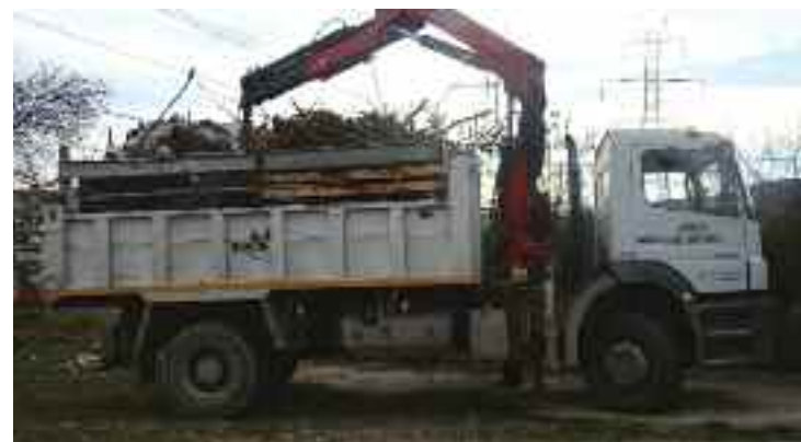
Φορτηγό του δήμου μαζεύει τα κλαδιά