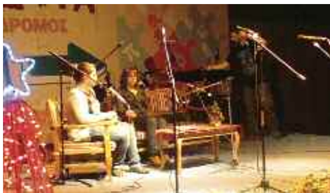
1ο Λύκειο Άνω Λιοσίων