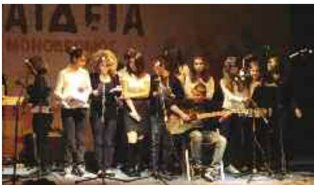
4ο Γυμνάσιο Άνω Λιοσίων