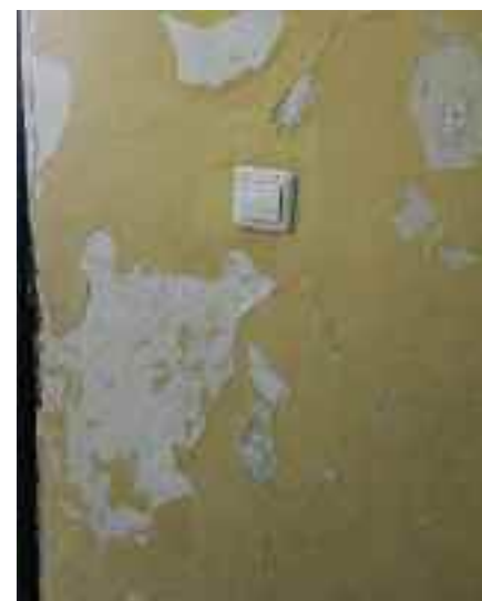
Υγρασία, και αποκόλληση σοβάδων στους τοίχους των αποδυτηρίων