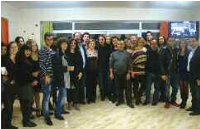
Αναμνηστική φωτογραφία των μελών του Συλλόγου