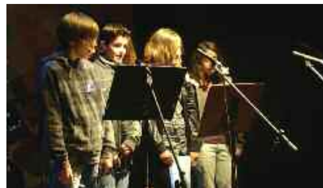
2ο Γυμνάσιο Ζεφυρίου