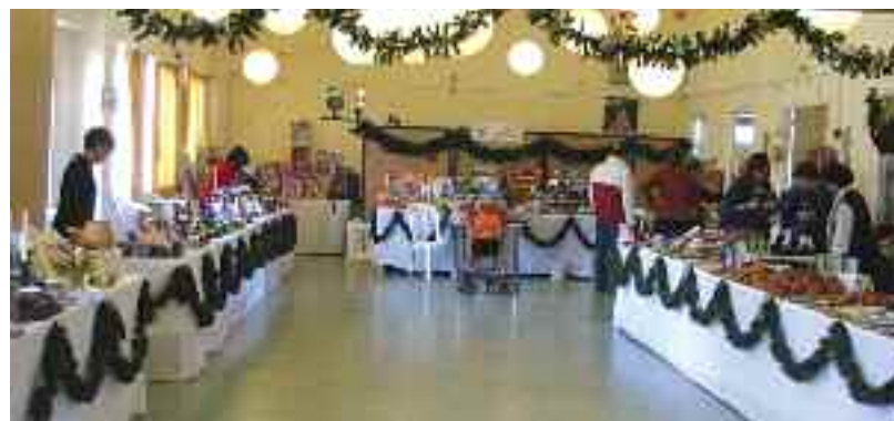
Χρηστικά και όμορφα αντικείμενα εκτέθηκαν στο διήμερο bazaar