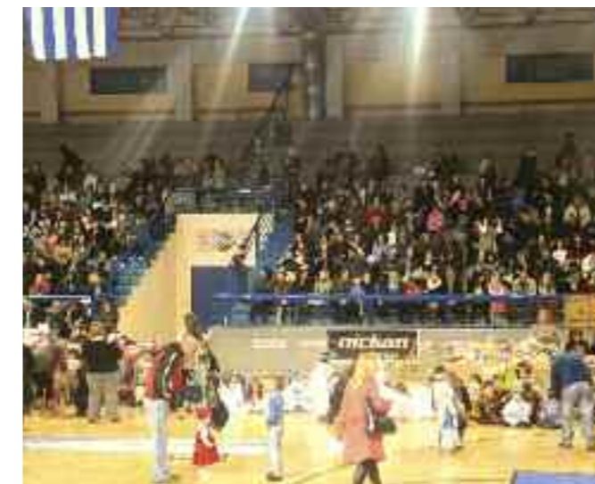
Κατάμεστο το κλειστό Ζωφριάς