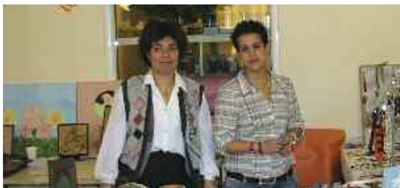
Χαμόγελα, παρά τη δύσκολη εποχή, για εργαζόμενες και παιδιά της Αρωγής