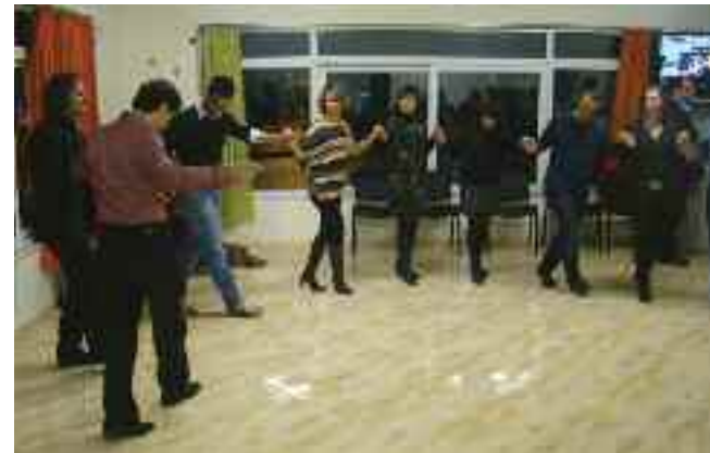
Το γλέντι ξεκίνησε το απόγευμα και κράτησε μέχρι αργά το βράδυ