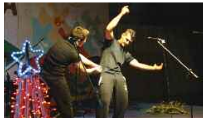
Οι μαθητές του ΕΠΑΛ- ΕΠΑΣ σε μια διασκευή του «Κοντορεβουθούλη»