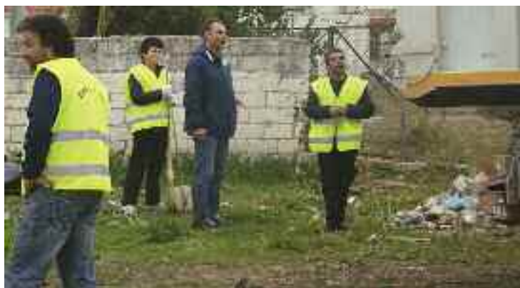
Οδοκαθαριστές και φορτηγά επί το έργο