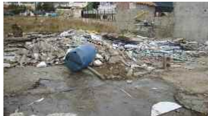
Μπάζα και σκουπίδια που θα καθαριστούν

δρόμων, ο Βασίλης Γεωργιάδης σημείωσε ότι θα ξεκινήσει εντός της εβδομάδας ενώ τόνισε ότι η πόλη είναι φωτισμένη στο μεγαλύτερο μέρος της. «Δεν σας κρύβω ότι παραλάβαμε ένα δήμο σε δύσκολη κατάσταση, για παράδειγμα είχαν κλαπεί από τους δρόμους, περισσότερες από 400 σχάρες. Τώρα έχουμε εφαρμόσει ένα σύστημα με το οποίο ασφαλιζονται και στο διάστημα των 10 μηνών που έχει περάσει, δεν έχει κλαπεί ούτε