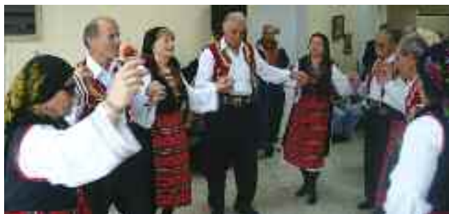
Το χορευτικό των ΚΑΠΗ στα Άνω Λιόσια

Από την πλευρά της, η αντιπεριφερειάρχης Δυτικής Αττικής Σταυρούλα Δήμου ευχήθηκε καλές γιορτές σε όλους και εξέφρασε την πεποίθηση ότι με ενότητα και υπομονή, οι Έλληνες θα καταφέρουν να ξεπεράσουν τα προβλήματα και να ορίσουν τη ζωή τους σε νέες βάσεις.