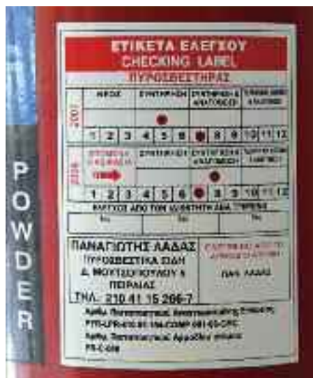
Οι πυροσβεστήρες χρειάζονται αναγόμωση. Έχουν λήξει από τον Ιούλιο του 2008