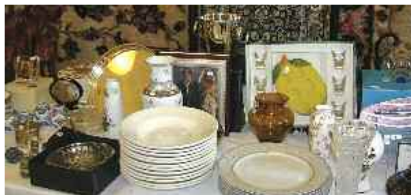
Τα αντικείμενα επλέχθηκαν με προσοχή και μεράκι