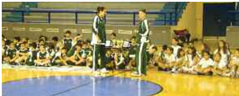
Αθλητές και αθλήτριες των ακαδημιών μπάσκετ